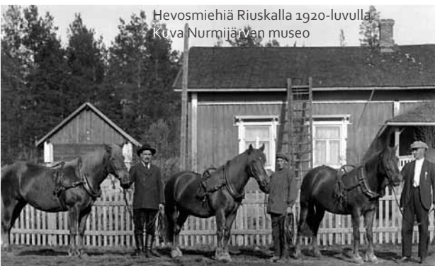
Hevosmiehiä Riuskalla 1920-luvulla.