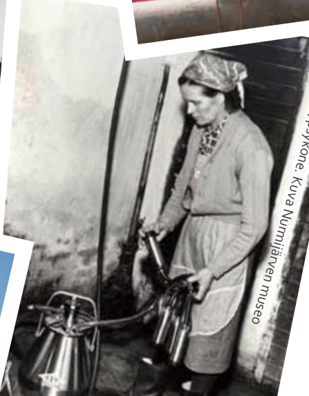
Annin ja Iivyskone.