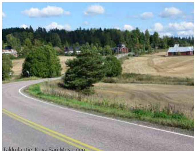
Takkulantie.