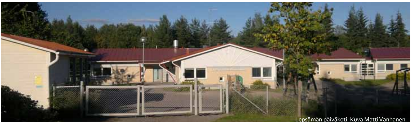
Lepsämän päiväkotit.