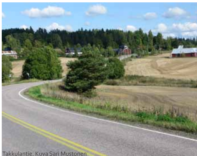
Takkulantie.