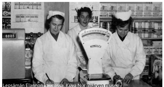
Lepsämän Elannon kaupassa.

Huomattavan lisän asujaimistoon kylä sai karjalaisten asuttamisen myötä 1950-paikkeilla. Kylän palvelut lisääntyivät. Maatalouden koneellistaminen vähensi maatyöväen määrää. Karjanhoito hävisi melkein kokonaan, tilalle navetoihin tuli pienyrityksiä tai hevostallinpitäjiä. 1990-luvulla hävisivät kaupat, pankit ja posti. Klaukkalan kasvu levitti asutusta myös Lepsämään päin; syntyi uusi moderni omakotialue Kalkeri. Lepsämästä tuli palveluiden suhteen Klaukkalan satelliitti, mutta vanhan maanviljelyskylän ilme säilyi. Kylän asukkaista vain muutama prosentti saa enää elantonsa maataloudesta. ■