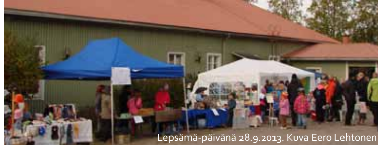
Lepsämä-päivänä 28.9.2013.

Enemmistö vastaajista halusi kyläjuhlat (85). Kävelytiet nousivat koko kyselyn toivotuimmaksi uudistukseksi 115 vastaajan voimin. Kävelyteiden tärkeysjärjestykseksi kyselyssä nousi 1. Selintie, 2. Takkulantie,