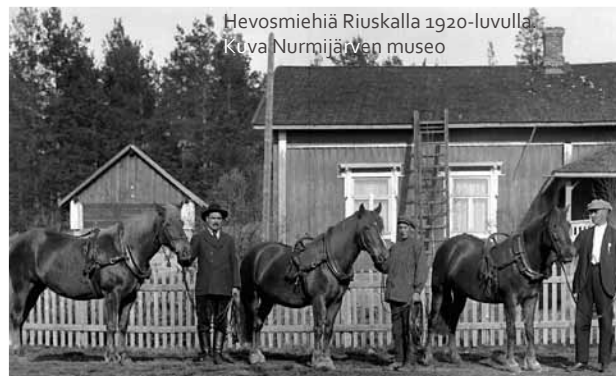
Hevosmiehiä Riuskalla 1920-luvulla.