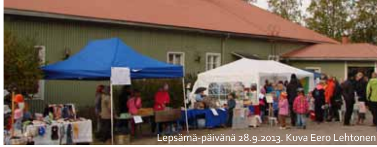
Lepsämä-päivänä 28.9.2013.

Enemmistö vastaajista halusi kyläjuhlat (85). Kävelytiet nousivat koko kyselyn toivotuimmaksi uudistukseksi 115 vastaajan voimin. Kävelyteiden tärkeysjärjestykseksi kyselyssä nousi 1. Selintie, 2. Takkulantie,