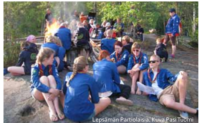
Lepsämän Partiolaisia.

Lepsämäläisiä toimii myös monissa muissa Klaukkalan tai koko pitäjän käsittävissä yhdistyksissä. ■