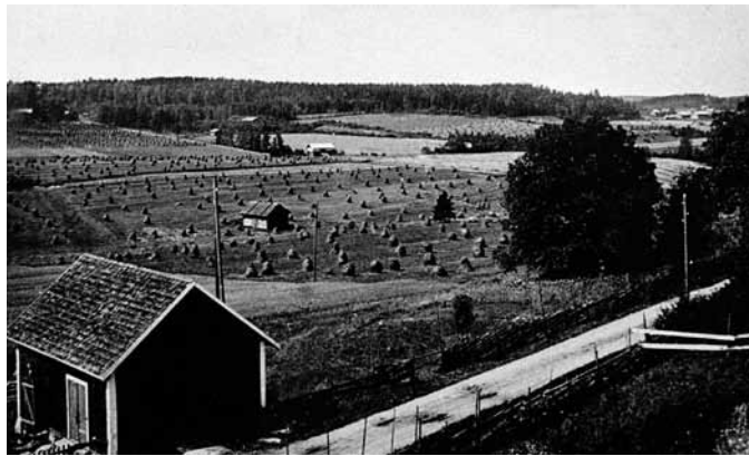
Lepsämän jokilaakso 1930-luvulla.