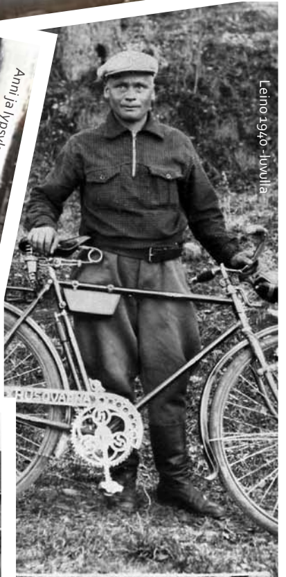
Leino 1940 -luvulla