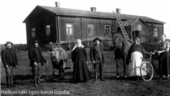
Helkun väki 1910-luvun lopulla.

Keskiajan loppupuolella Lepsämänjokilaaksossa liikuneet turkispyytäjät havaitsivat liikkueensa riistapoluillaan, että jokeen viettävät etelä- ja länsirinteet tarjosivat mahdollisuuden peltoviljelyyn. Jokivarsiniityt takasivat luonnonheinän saannin karjan ravinnoksi. Kun sitten Uudenmaan sisäosien asuttaminen joskus 1300-luvun puolivälissä tapahtui, Lepsämään saapui asukkaita niin Hämeen kuin ruotsinkielisen rannikonkin suunnasta. Talojen nimissä näkyy molempien suuntien vaikutusta. Ryhmäkyläkeskukset Ali-Lepsämä ja Yli-Lepsämä sijoittuivat parikymmentä metriä joenpinnan ja rinnepeltojen yläpuolelle sijaitseville tasanteille. Kylän sijainti oli paitsi kielirajan lähellä myös pitäjänrajan ja lääninrajan tuntumassa. Etelässä Espoossa puhuttiin ruotsia, lännessä vastassa oli Vihdin pitjä ja Raaseporin lääni, kun taas Lepsämä kuului Porvoon läänin Helsingin pitjään.